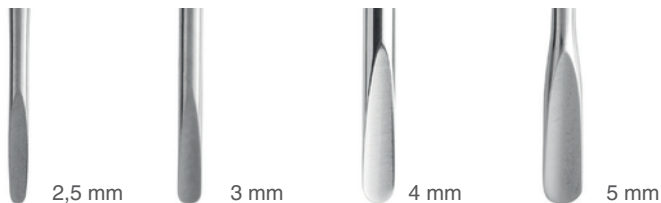
Luxating 2 LM 812220 VET Luxating 3 LM 812230 VET Luxating 4 LM 812240 VET Luxating 5 LM 812250 VET

Luxačné nástroje sú dostupné v štyroch rôznych veľkostiach čepelí.