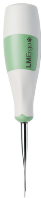
Root Luxating LM 812210 VET

Nástroj Root Luxating je určený na jemné uvoľňovanie koreňov.