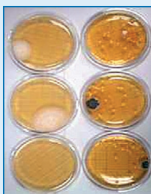
Bez použitia prístroja AD 2.0 Nárast organizmov počas 7 dní