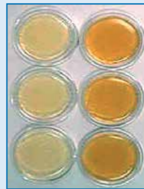
S použitím prístroja AD 2.0 Bez nárastu baktérií a plesní

AD 2.0 prístroj zredukuje približne 99,99% baktérií a vírusov v uzavrenom priestore za menej ako hodinu. Účinne bojuje proti baktériám, ktoré sú zodpovedné za väčšinu infekcií (S. aureus, C. difficile...) a vzduchom prenášané choroby ako napr. tuberkulóza.