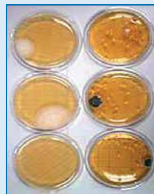
Bez použitia prístroja AD 2.0 Nárast organizmov počas 7 dní